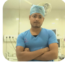
Emergency Medical Technician Cloud Nine Hospitals

অনেক প্রতিকূলতা অতিক্রম করে বর্তমানে একটি নামী ডায়ালিসিস ইউনিটে চাকরী করছেন।