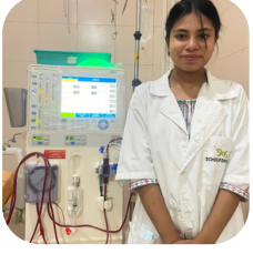
Dialysis Technician Apollo Dialysis Clinics