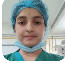
Emergency Medical Technician, V One Hospital, Indore

কালিম্পঙের পাহাড়ে জন্ম ও বড় হয়ে ওঠা। বর্তমানে ব্যাঙ্গালোরে একটি নামী হাসপাতালে চাকরী করছেন।